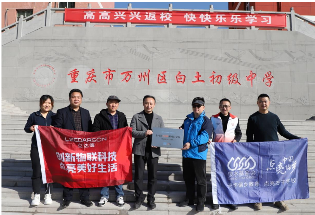
▲白土初级中学合影