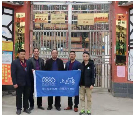
东山瑶族乡民族初中

2020年11月8-17日泉水基金会会同广西民族教育发展基金会对18所学校共260间晚自习教室改善照明后的晚自习教室进行了实地验收。泉水基金会验收过程中, 对存在的灯具安装问题进行了书面反馈。