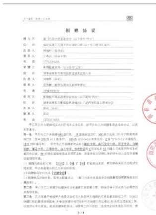
图 2 捐赠协议

2023年5月19日,基金会与礼县教育局签订了三方协议,并发出立达信全护眼教育照明灯具到各个学校。学校在收到灯具后由教育局协调安装队统一对灯具进行安装,暑假期间完成所有安装工作。安装过程中基金会给予了远程的安装指导,及时指出灯具安装中存在的问题。