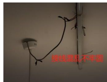
表 3 王市中学验收问题及整改要求